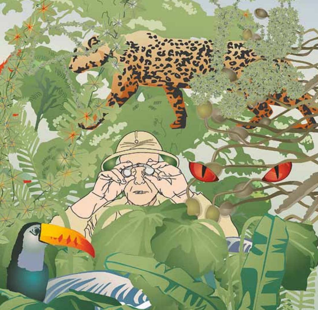
ILLUSTRATIONER: IVA TROJ ZLATEV

frågor om. Den kan vara svår att överblicka för den som inte är insatt.